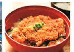
訓子府たれカツ丼