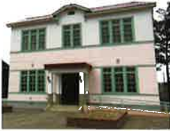
北見ハッカ記念館