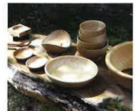
森林工芸品「オケクラフト」