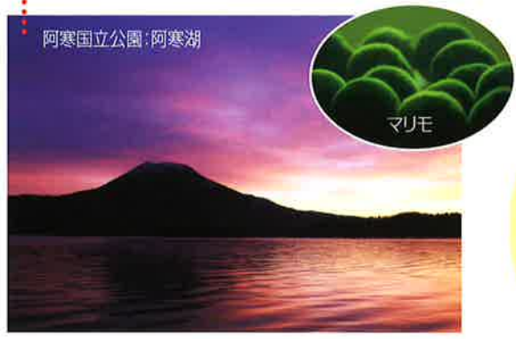
阿寒国立公園:阿寒湖