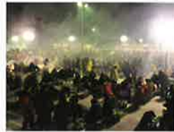
北見厳冬の焼肉まつり